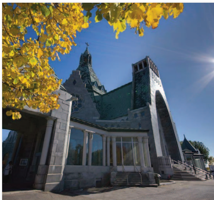
La Basilique Cap-de-la-Madeleine